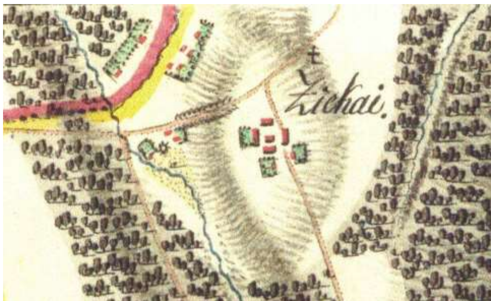
Obr. 16. Cikháj na mapě Moravy vyhotovené v rámci prvního vojenského mapování (1764–1783).