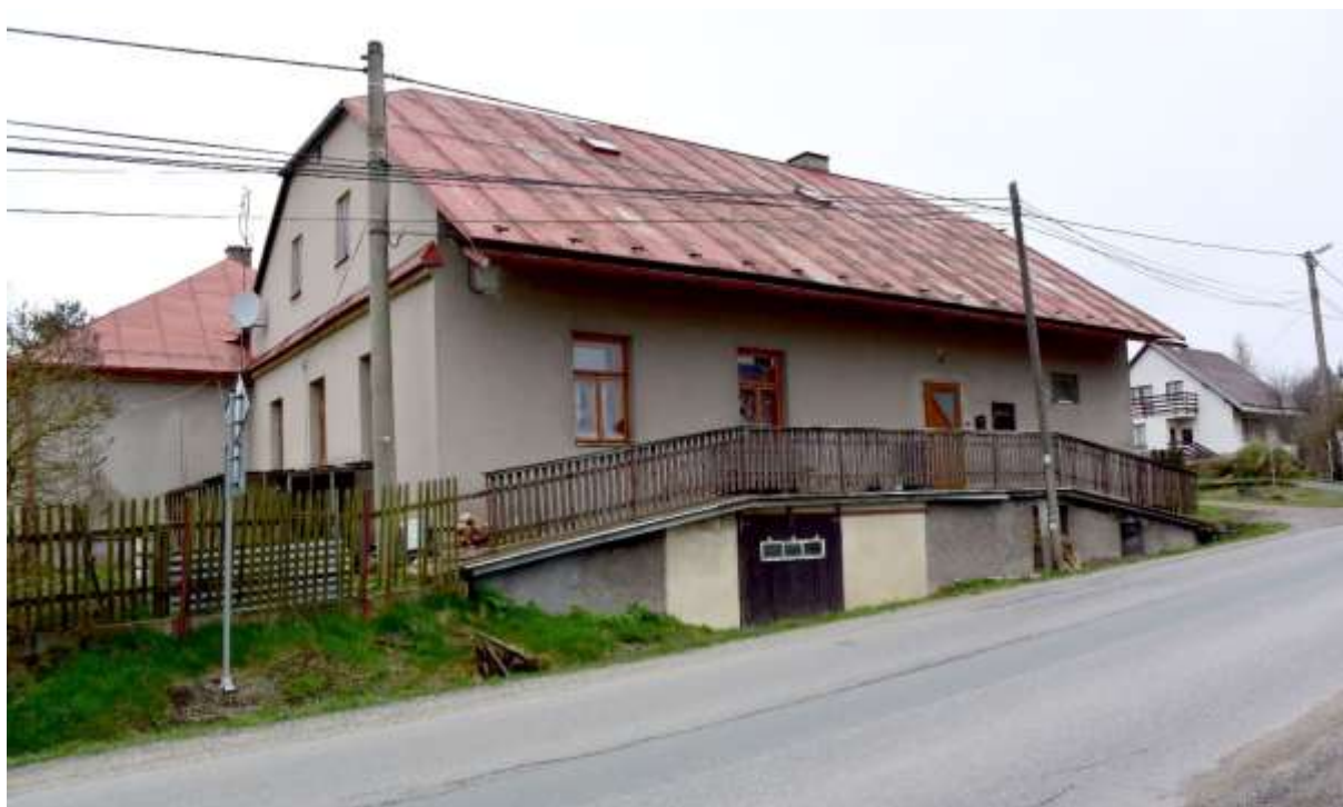
Obr. 19. Cikháj, stavení čp. 16 na snímku z roku 2016.

Další nepřímá stopa po cikhájské sklárně se nachází v již citovaném Svobodově stručném přehledu familiantů usazených v rámci emfyteuze u bývalého panského dvora. Patřili mezi ně i Václav Cempírek a Josef Bureš, kteří si odkoupili „část draslovny“ na pozemku o velikosti dvou familií, kde si pak postavili domky čp. 25 a čp. 26. 45 Polohu draslárny, v níž se pro cikhájskou huť vyráběla z dřevného popela potaš, tehdy nezbytné sklářské tavivo, tak lze snadno určit (obr. 5:3, 10:3). Od předpokládaného stanoviště sklářské hutě ji dělilo jen asi 70 metrů. Návaznost výroby potaše na provoz sklárny je tedy zjevná, i když vrchnost mohla s potaší obchodovat také nezávisle, či ještě dlouho po zániku sklárny.