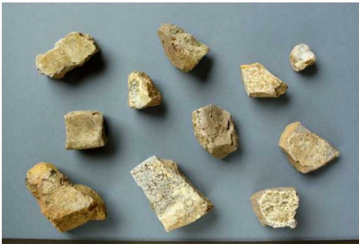
Obr. 8. Vzorokly zlomků sklářských pánví, resp. šamotu. Sběr v poloze U přiřhůnka, 2016.