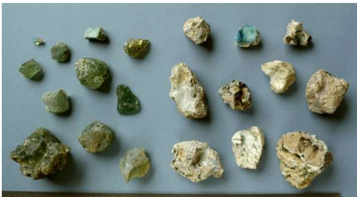
Obr. 7. Vzorok skelných tavenin a šamotu s taveninovým sklem. Sběr v poloze U přihůnka, 2016.