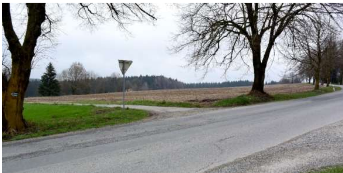
Obr. 6. Naleziště sklářského odpadu na polích v poloze U přihůnka. Pohled od jihovýchodu. Foto autor, 2016.