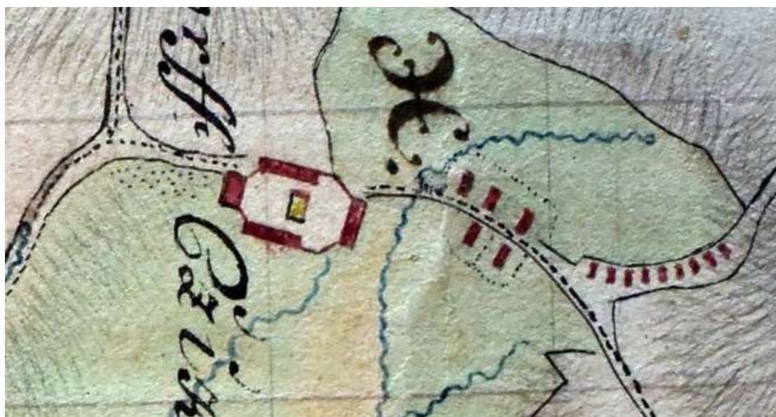
Obr. 14. Panský dvůr v Cikháji a emfyteutizační zástavba v jeho východním sousedství na detailu mapy lesů žďárského panství z roku 1796. U stavení, nacházejícího se přibližně v prostoru dnešního čp. 30, je na dnes zmizelé vodoteči ještě zachycen pravděpodobný „hutní rybníček“ – rezervoár vody pro sklářský provoz. Zdroj: MZA v Brně, f. F 214, inv. č. 2732, Geometrische Plan 1796. Foto autor.

Existují ještě další skutečnosti, které zvyšují jistotu v lokalizaci cikhájské sklárny. Jižně od Popelova stavení byl u protilehlého domu čp. 43 (tzv. Weisovo stavení) na několika málo krčinách vyskytujících se až u jižního okraje parcely č. 133 (trvalý travní porost), vymezeného ohradníkem sousední pastviny, zaznamenán poměrně nápadný výskyt drobných fragmentů skelných tavenin, šamotu a křemene (obr. 10:6). A jižně od čp. 43 se v terénu pastviny projevuje už jen slabě znatelnou terénní nerovností stopa po zaniklém bezmála miniaturním rybníčku (obr. 10:4), který podle Hegenbartovy vzpomínky existoval ještě v polovině 20. století. Tento rybníček pravděpodobně představoval poslední svědectví o někdejší malé vodoteči, která, jak ukazuje mapa lesů žďárského panství z r. 1796, protékala také vedle stavení identifikovatelného jako čp. 30 (obr. 14). A právě u něj, v jeho bezprostředním západním sousedství, je na jejím toku zakreslena malá vodní nádrž, kterou lze vyložit jako bývalý „hutní rybníček“, založený pro potřeby sklářské hutě.