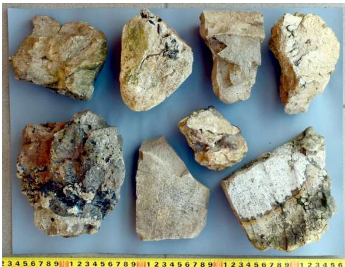
Obr. 13. Soubor nálezů objevených v roce 2017 u paty sloupu poblíž stavení čp. 30.