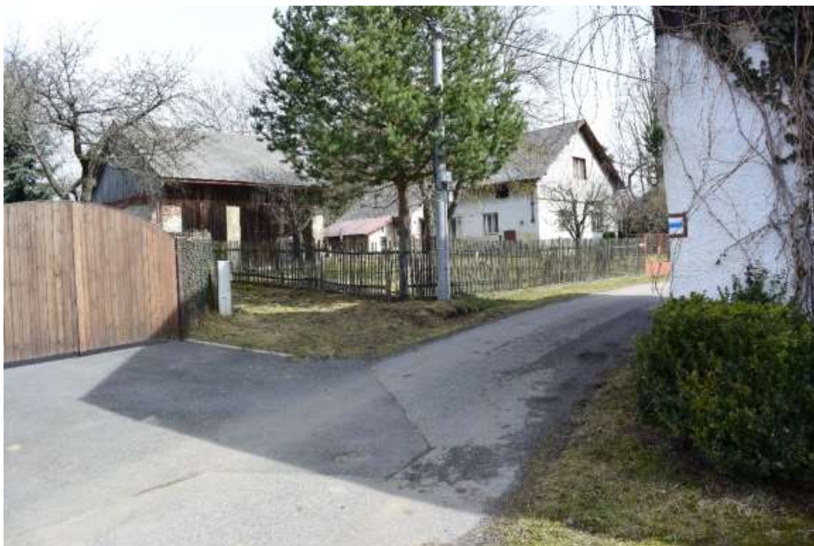
Obr. 12. Cikháj, místní část Dvůr. Stavení čp. 30 zvané Popelovo z pohledu od jihozápadu. Uprostřed záběru betonový sloup, u jehož paty byly nalezeny zlomky sklářských pánví, šamotu a fragment patrně pecní vyzdívky. Foto autor, 2017.