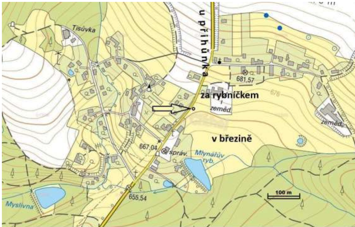
Obr. 4. Lokalizace pomístních/trat'ových názvů U příhůnka, Za rybníčkem a V březině na dnešní mapě Cikháje podle Rudolfa Hegenbarta. Poloha rybníčku vztahujícího se k názvu Za rybníčkem je označena šipkou. V uvedených tratích byl před více než sto lety zaznamenán výskyt sklářských archeologických nálezů. Mapový podklad: http://nahlizeniidokn.cuzk.cz/ .

dnes již téměř zmizelého „rybníčku“ a určení poloh V březině, Za rybníčkem a U příhůnka (obr. 4).