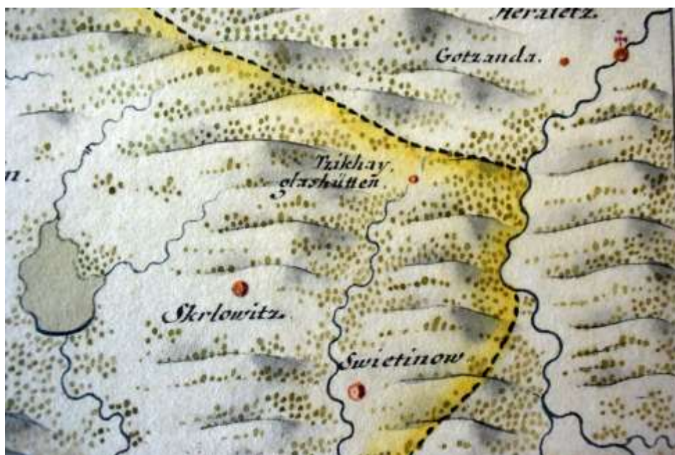
Obr. 2. Sklářská huť Cikháj na detailu Müllеровy rukopisné mapy Čáslavského kraje z roku 1717.