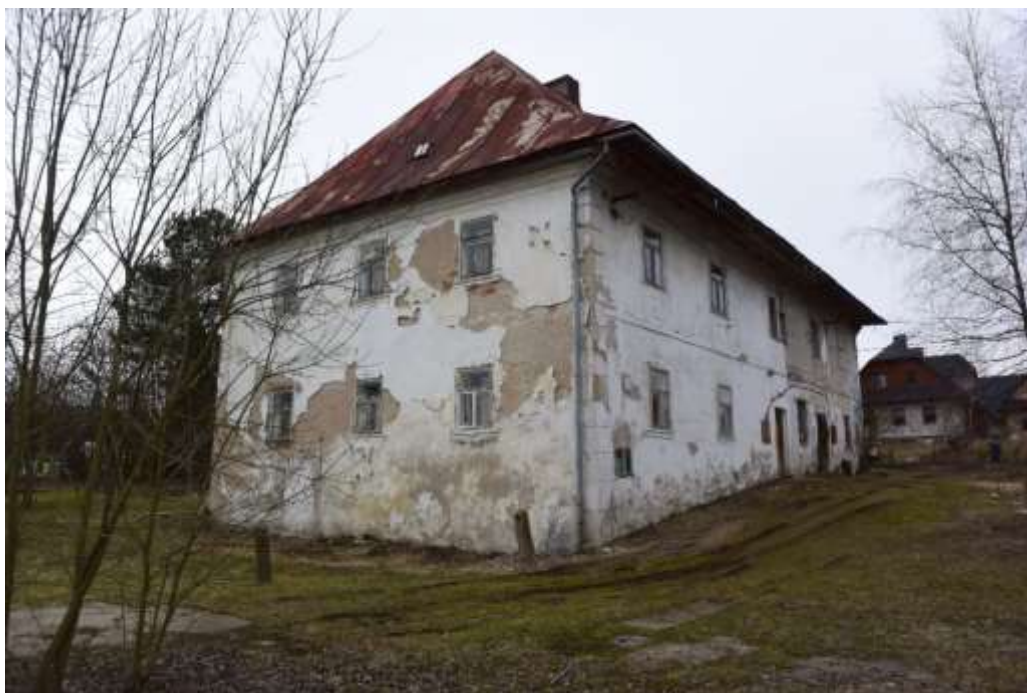
Obr. 17. Cikháj, místní část Dvůr. Západní, obytné křídlo čtyřstranného panského dvora z pohledu od jihovýchodu.