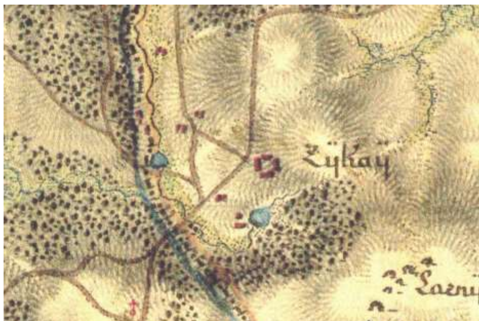
Obr. 15. Cikháj na mapě Čech vyhotovené v rámci prvního vojenského mapování (1764–1783).