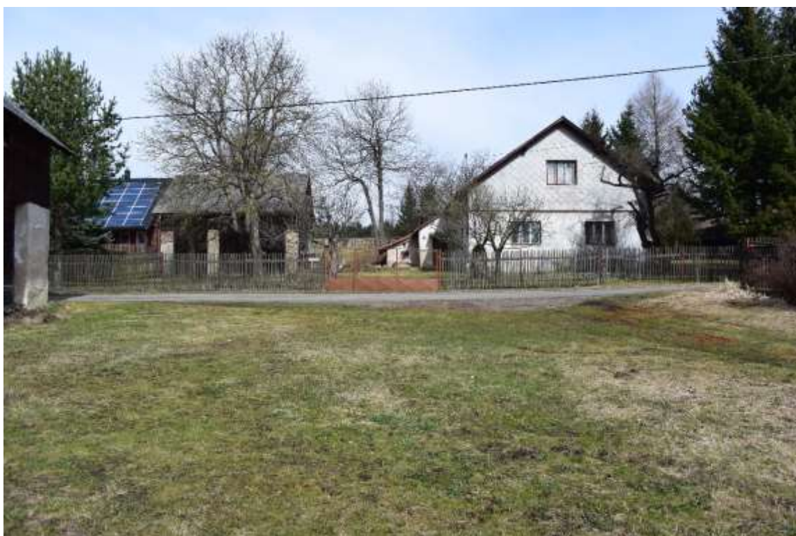
Obr. 11. Cikháje, místní část Dvůr. Pohled na tzv. Popelovo stavení (čp. 30) od jihu. Foto autor, 2017.

Při prohlídce parcel přilehlých k čp. 30 nebyla zjištěna žádná zjevná „sklářská“ stopa. Registrován zde byl povrch terénu celkem ještě nezasažený aplanační kultivací. Podél východního oplocení se na něm projevovala protáhlá mělká vkleslina, zřetelně způsobená sedáním zeminy (obr. 10:7). Pozitivní nález byl učiněn v bezprostředním sousedství areálu čp. 30, a to u paty betonového sloupu elektrického vedení (obr. 10:5, 12), v malém zbytku výhozu zeminy pocházejícím nepochybně z hloubení základu pro uvedený sloup. Na povrchu i na bočním narušení tohoto výkopku bylo možné rozeznat několik fragmentů sklářských pánví, resp. šamotu. Celkem bylo odtud vyjmuto osm kusů nálezů (obr. 13). Z nich stojí za pozornost fragment okraje dna pánve (síla stěny 38 mm, síla dna 42 mm, průměr dna cca 44 cm) s uvnitř dochovaným pánvovým sklem, fragment stěny pánve, jejíž průměr v horním okraji přesahoval 48 cm, fragment šamotové cihly (šířka >10 cm, délka >11 cm a výška, resp. tloušťka >7 cm), jejíž dochovaný povrch je pokryt vrstvou taveninového skla, a fragment vyzdívky pece obsahující kámen, zlomek cihly a taveninové sklo. Velikost nálezů, dosahující 9 až 17 centimetrů, i jejich výskyt v kumulaci představují významné potvrzení pamětnické informace o Popelově stavení nacházejícím se v místech cikhájské sklářské hutě.