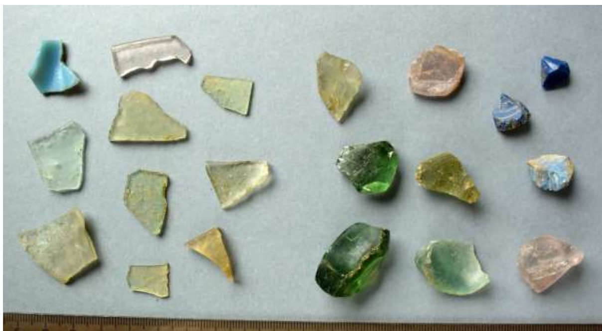
Obr. 9. Zlomkly skla (artefaktů, pracovního odpadu a tavenin). Sběr v poloze U přiřhůnka, 2016.