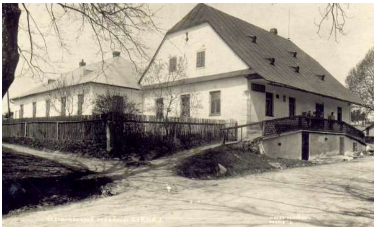
Obr. 18. Cikháj, stavení čp. 16 – bývalá panská hospoda, odkazující svým někdejším názvem U šroubařů, případně Ve šroubně, na sklářskou minulost. Snímek z roku 1945.