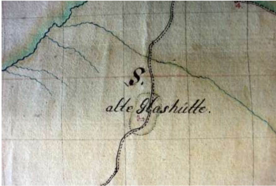
Obr. 3. Bezejmenná opuštěná sklářská huť na severovýchodním okraji cikhájského lesního revíru zakreslená na mapě lesů žďárského panství z roku 1796.

Je pravděpodobné, že uvedené krátkodobé obnovení provozu souviselo s přebytkem polomového dřeva na Žďárských vrších po rozsáhlé větrné kalamitě v roce 1740, který se stal podnětem pro založení několika sklářských hutí, 30 k nimž patřila i již zmíněná klášterní huť Kocanda (1747–cca 1773). Zda se v Cikháji vyplatilo k roku 1753 znovu zprovoznit dvě tři desítky let opuštěnou sklárnu a dopravovat k ní polomové dřevo, je otázkou. Je spíš pravděpodobnější, že zprávy z let 1753–1756 se budou týkat nově postavené hutě na klášterním panství, jejíž stanoviště se nalézalo v cikhájském lesním revíru, a to až u jeho okraje, přibližně tři kilometry severovýchodně od Cikháje, v poloze i dnes spadající do cikhájského katastrálního území. Důkaz o někdejší existenci této zatím bezejmenné sklárny podává už zmíněná mapa lesů žďárského panství z roku 1796 (obr. 3). 31 Hypoteticky tak lze uzavřít, že na žďárském klášterním panství byly za vlády opata Bernarda Henneta (1738–1770) postupně založeny v