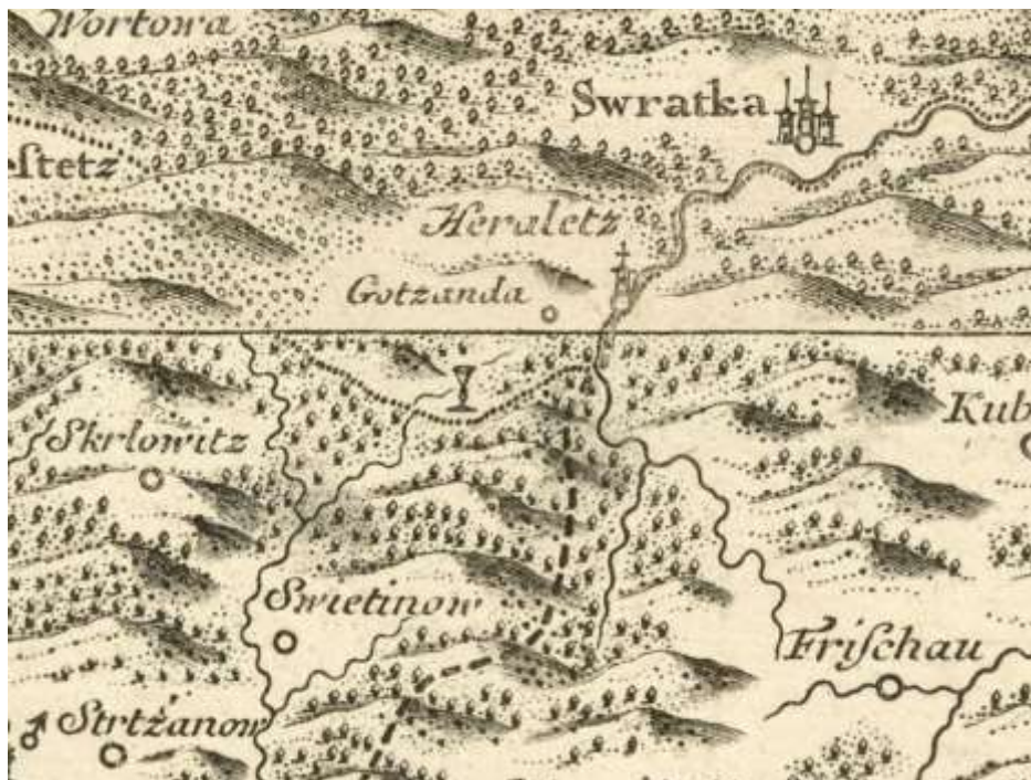
Obr. 1. Výřez z mapy Čech od Jana Kryštofa Müllera vydané roku 1720. Symbolickým pohárem je vyznačena sklářská huť v místě Cikháje.